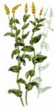
Ånate slingrar sig i grunda vatten.

Runt Holmöarna finns ankringsplatser på flera ställen. Förutom i Byviken (1) finns ankringsplatser i Klintviken (8), Vedögern (9), på Stora Fjäderägg (4) och på Holmögadd (14).