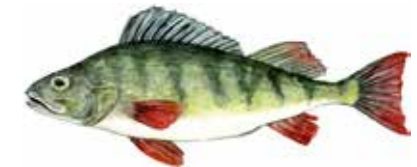
Abborrarna leker i de grunda vikarna.