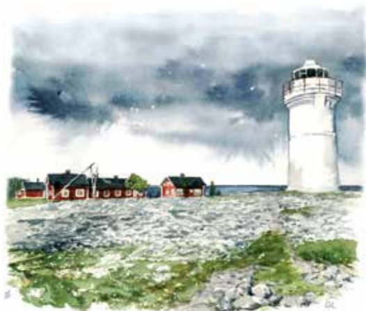
Stora Fjäderäggs fyr och fyrvaktarbostad som nu är vandrarhus.

Inlandsisen gav Holmöarna utseende och karaktär. Mer än något annat är det landhöjningen som orsakar variationsrikedomen. Längre har öarna varit befolkade, precis som idag. Jägare och fiskare har lämnat spår efter sig. Delar av öarna har varit betade och har öppna landskap. Holmöarna är en av kustens verkliga pärlor och här finns mycket att utforska!