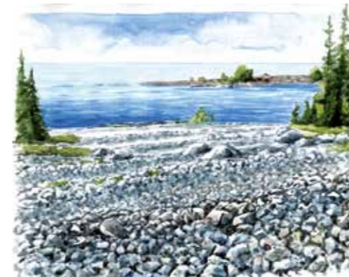
Strandvallar bildar en trappa på Trappudden.