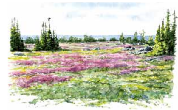
Ljungheden samsas med gamla granbestånd på Stora Fjäderägg.