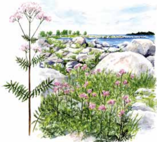
Holmögadds ensliga strandängar doftar starkt av vänderot.